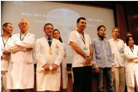
Intervenció pionera a Vall d'Hebron